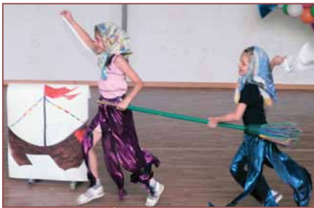
Три поросёнка, богатырь, Морозко и другие герои сказок в исполнении младших отрядов. страница 3