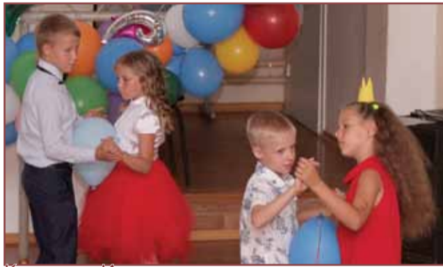
Конкурс «Идеальная пара» среди младших отрядов. Самые яркие фотографии. страница 2