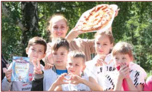
Закрытие смены, вожатский концерт, костёр и другие фотографии в рубрике «Stop кадр» страница 10-11