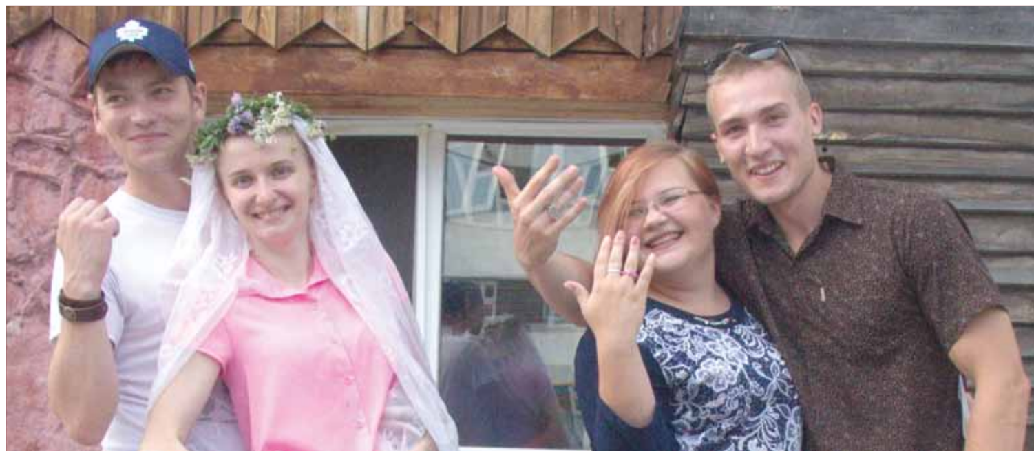
ЗАГС лагеря «Горный», организованный третьим отрядом. 2 смена, 2016 год