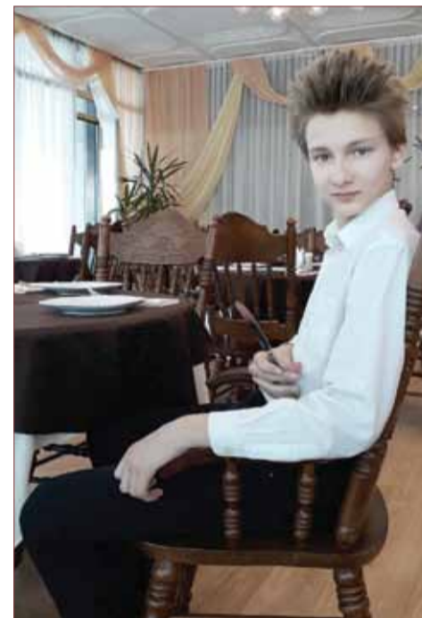
Дельфийские игры. Владивосток 2018 год